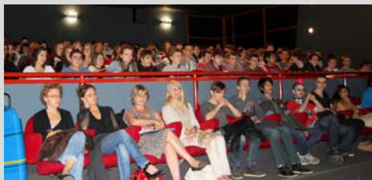
Les élèves des Lycées Jean XXIII et Jean Monnet lors de la projection du film Barbara