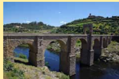
Pont romain d'Alcantara