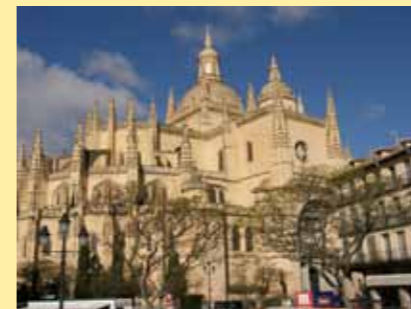
Aqueduc et cathédrale de Ségovie

Une vingtaine de personnes du Pays des Herbiers s'est rendue à Coria pour le 10ème anniversaire de la Carrera du 1er au 5 mai.