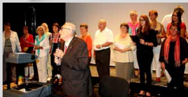
La chorale de l'école de Musique chante l'hymne européen