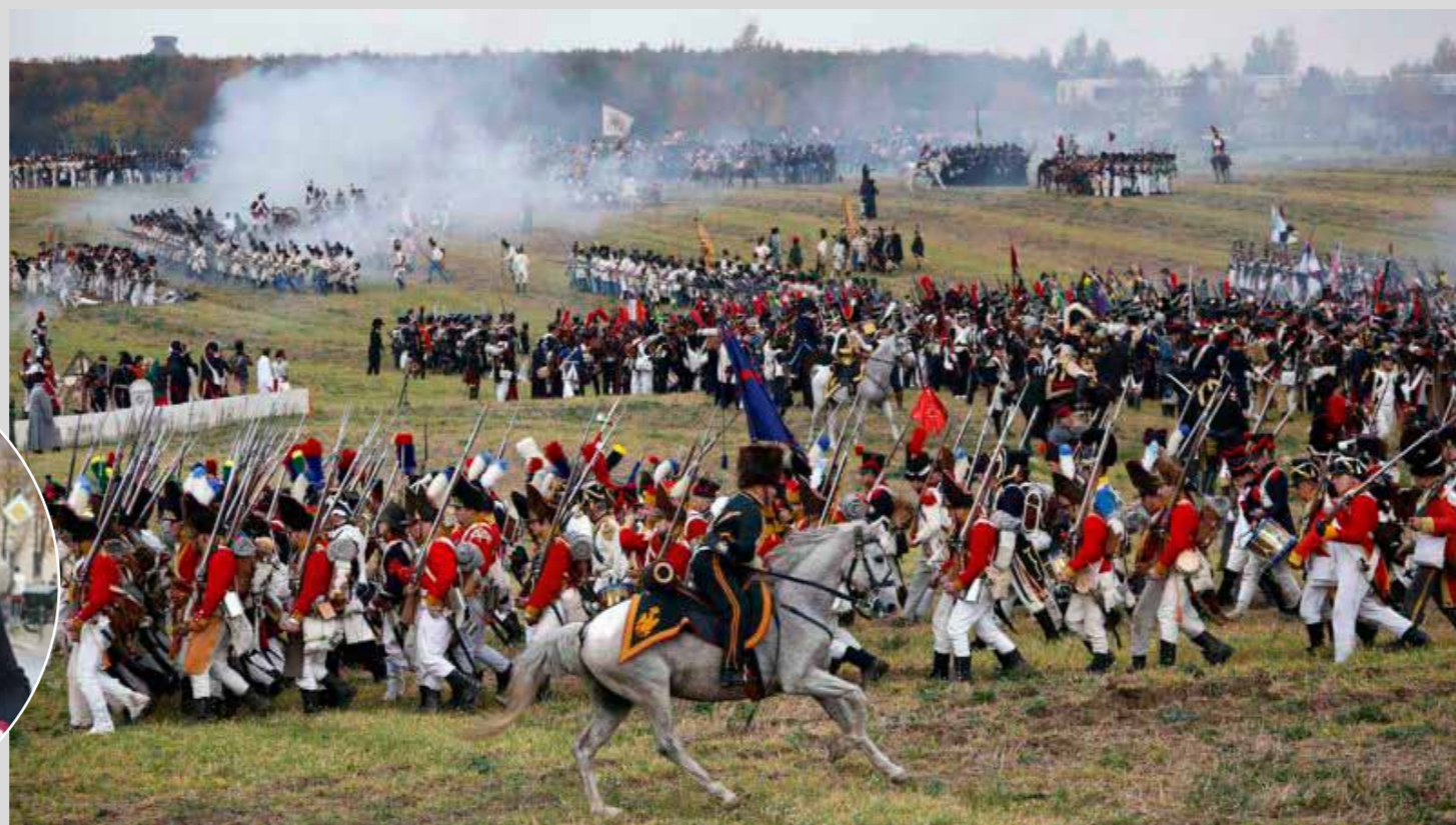
En 1813, lors de la Bataille des Nations, les armées de la coalition européenne imposent à Napoléon 1er une grave défaite à Leipzig. Cette Bataille, qui a fait 90 000 morts en 3 jours, est commémorée 200 ans plus tard.