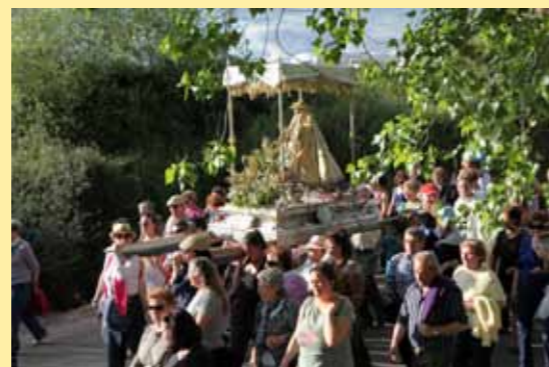
Procession de la Vierge de Argeme