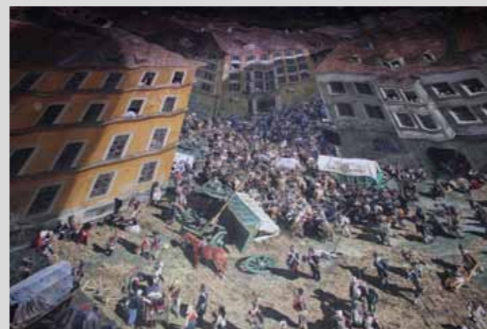
Exposition Panometer à Leipzig : la Bataille des Nations